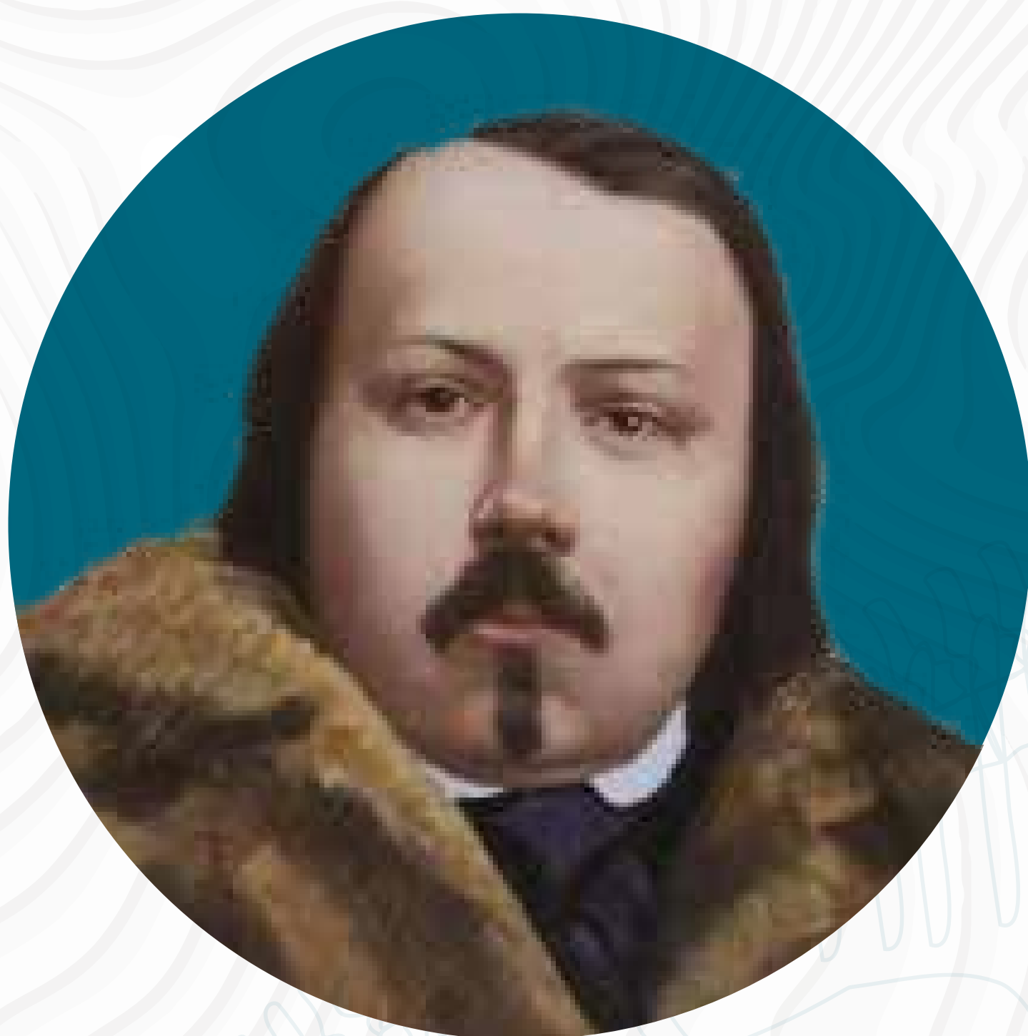
П. М. ЯЗЫКОВ

26 июня (7 июля) 1798 – 17 (29) июня 1851