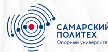
Самарский государственный технический университет