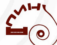
Палеонтологический институт имени А.А. Борисяка РАН