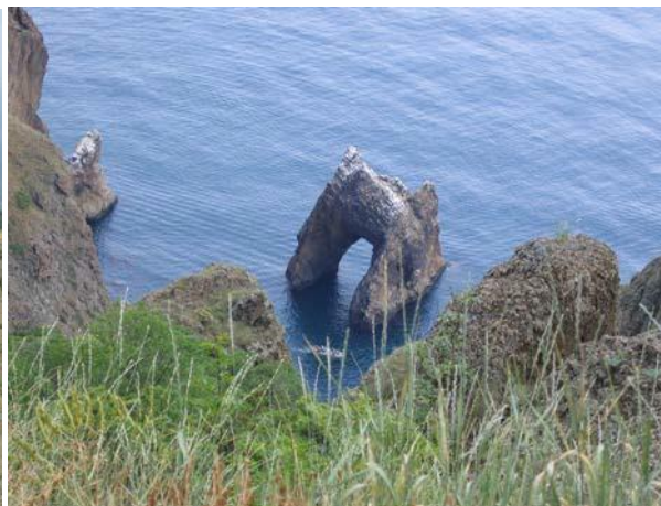
Карадагский природный заповедник,