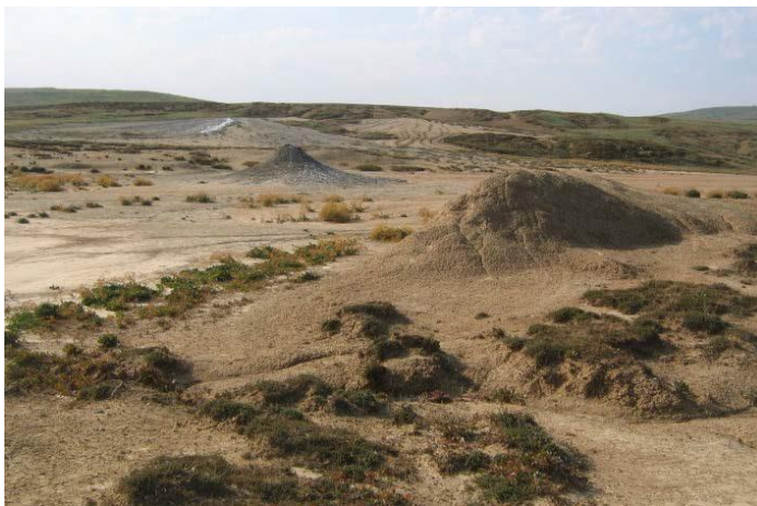
Булганакское поле грязевых вулканов