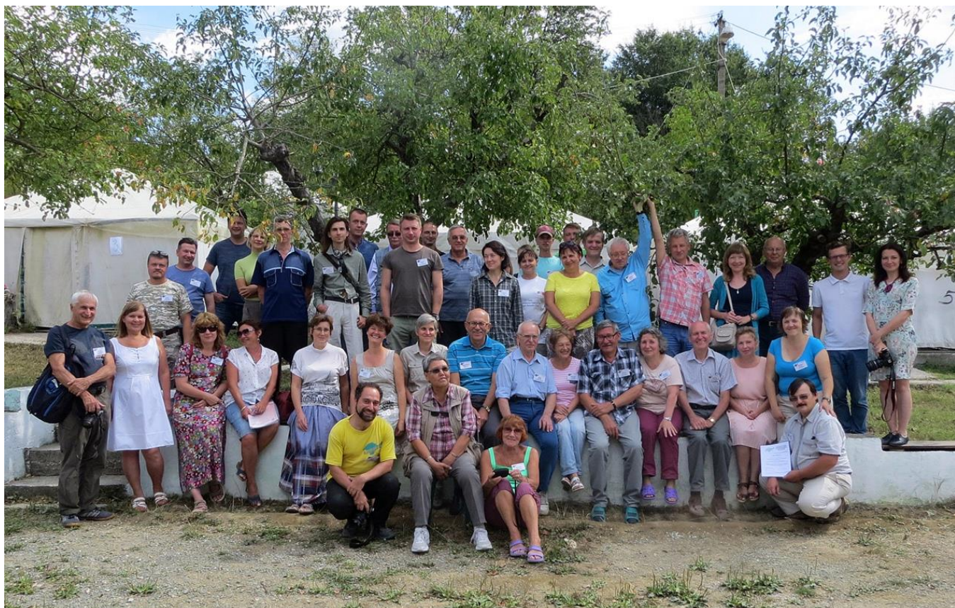
Конференция «Полевые практики – 2017»