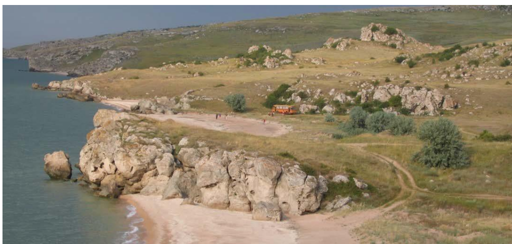
Караларский природный парк